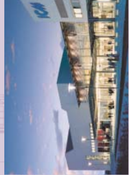
Glaskon-Kongress im ICM - Internationales Congress Center München